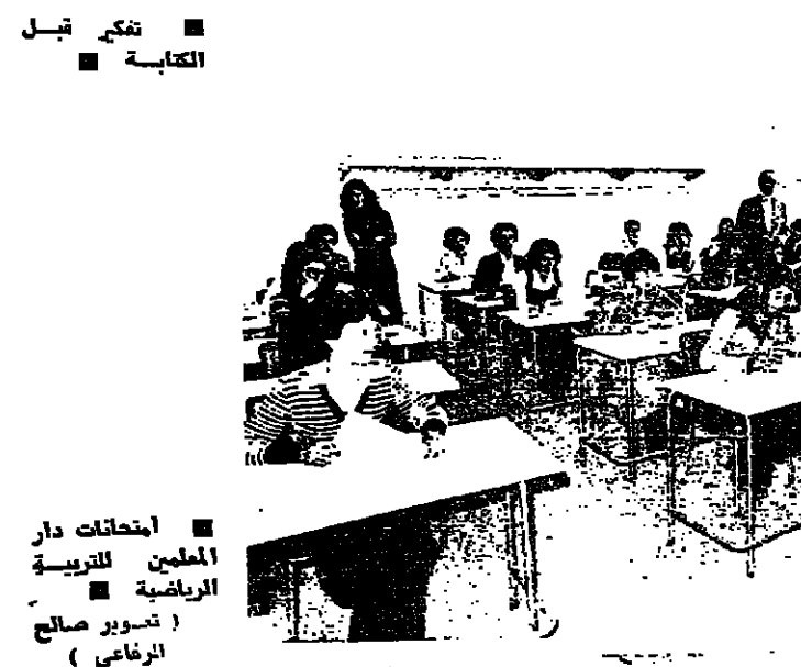
امتحانات دار المعلمين للتربية الرياضية

دار المعلمين للتربية الرياضية تشهد هذا العام انخفا كبيرا من حيث الاعداد المقدمة . فقد جرت منذ يومين وللمرة الاولى بعد الاحداث اول امتحانات قبول للسنه الاولى ، تقدم اليها ٥٠ طالب وطالبة لترشح منهم فعليا ٣٠٠ ، على الاسئلة كالتالي وعلى الطريقة ان يتم اختيار ٣٠ فتاة و ٣٠ شابا ، الا ان عدد المتقدمين ١٥٥ سؤالا تكون اجوبتهم بنص او لا . وامس جرت الامتحانات التطبيقية للطلاب في الهيئة الرياضية ، واليوم تجري لجان في الهيئة الرياضية ايضا . وتتوالى الامتحانات التطبيقية ، المتحارون الرياضية على مختلف انواعها من ركض وجيبار وتفرع عال . ويتوقع ان يكون عدد الفائزين لا يبالى به ، خصوصا وان اسلوب الامتحانات المتقدم هو اميركي ، وهذا الاسلوب مستحب لدى الطلاب ، وسهل كما انه يعطي صورة واضحة عن معرفة الطالب .